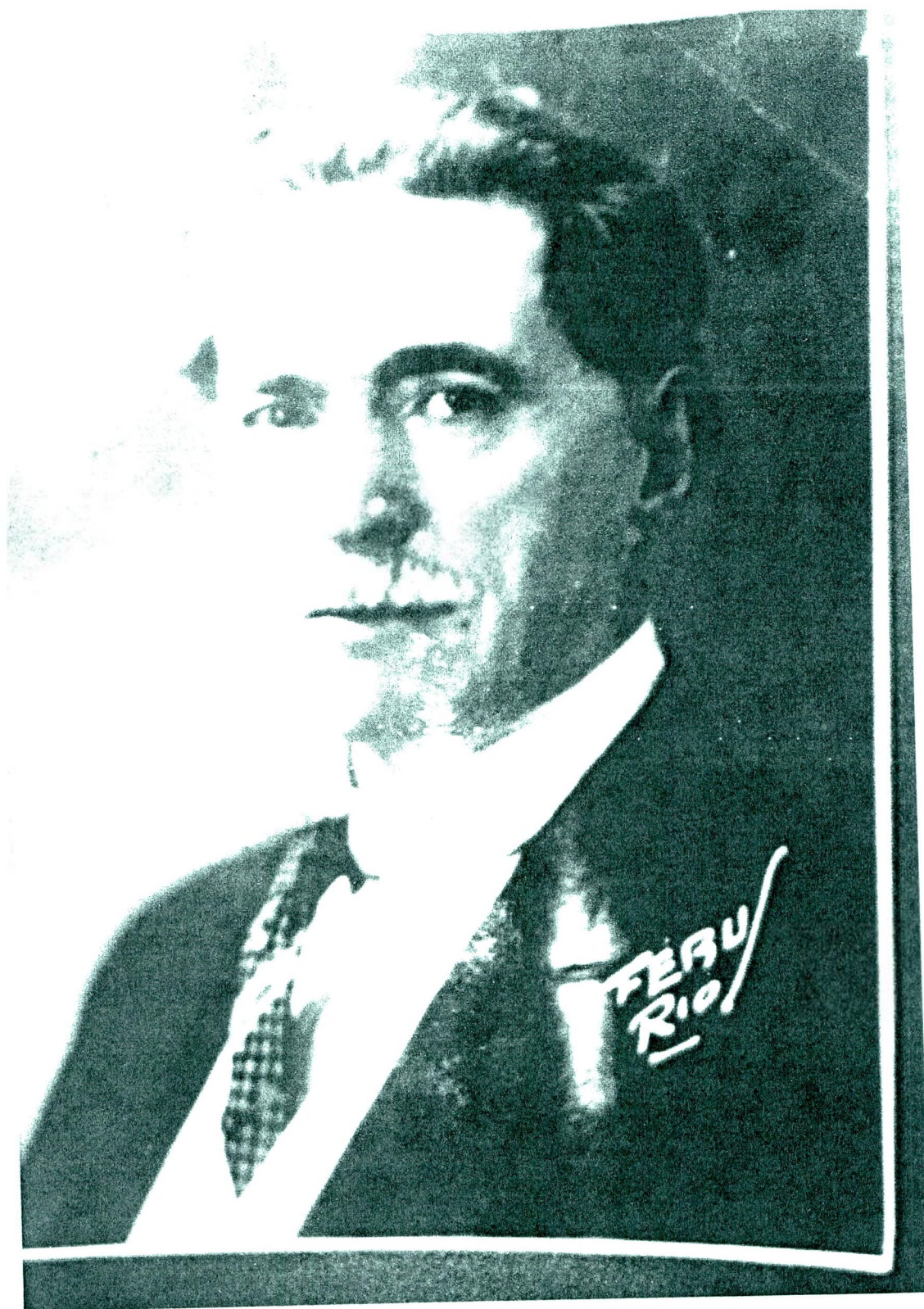
MANOEL BOMFIM (1868 -1932)