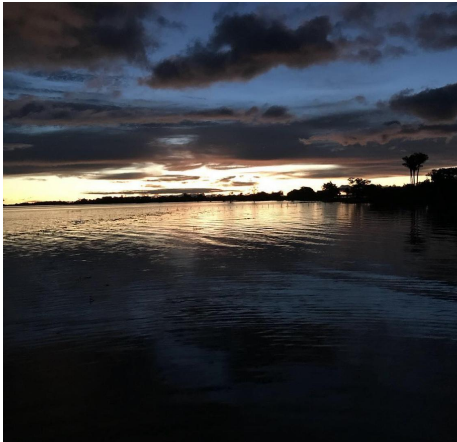
Anoitecer no Tapajós.