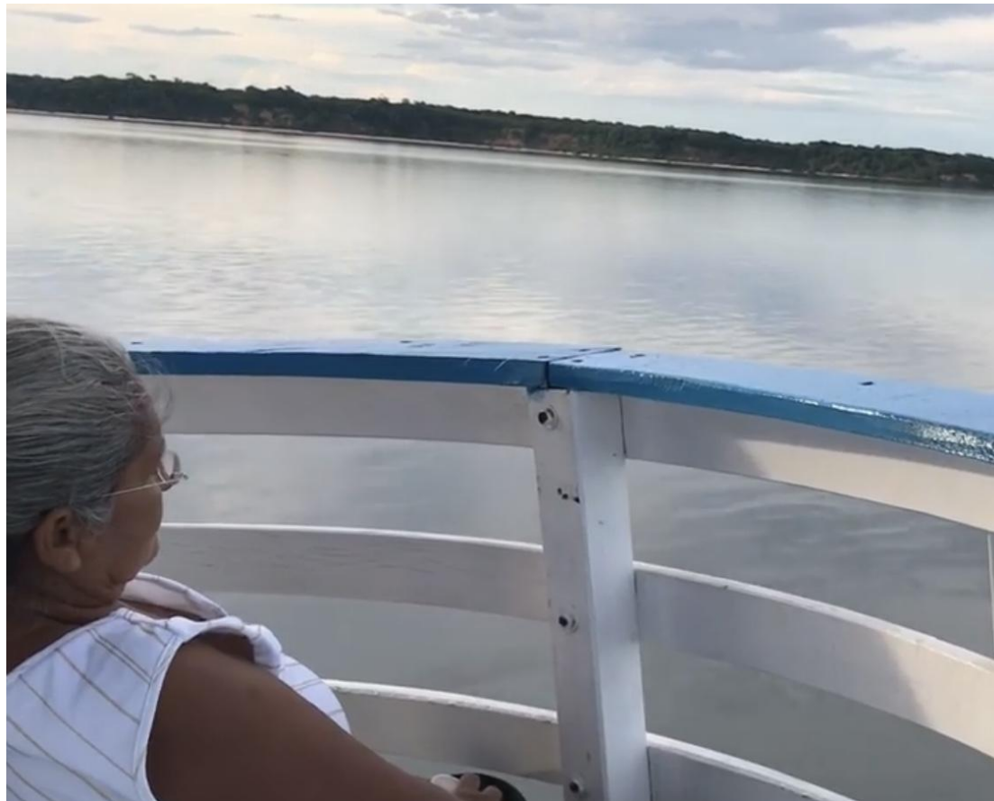
Senhora aprecia o rio Arapiuns, no retorno de encontro de mulheres organizado pelo Conselho Indígena Tapajós Arapiuns.