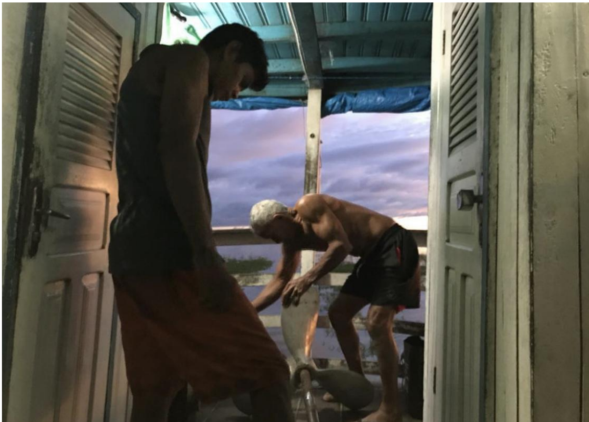
Barco sendo consertado após pane, logo que atravessamos para a margem esquerda do Tapajós, próximo à chegada ao território Tupinambá.