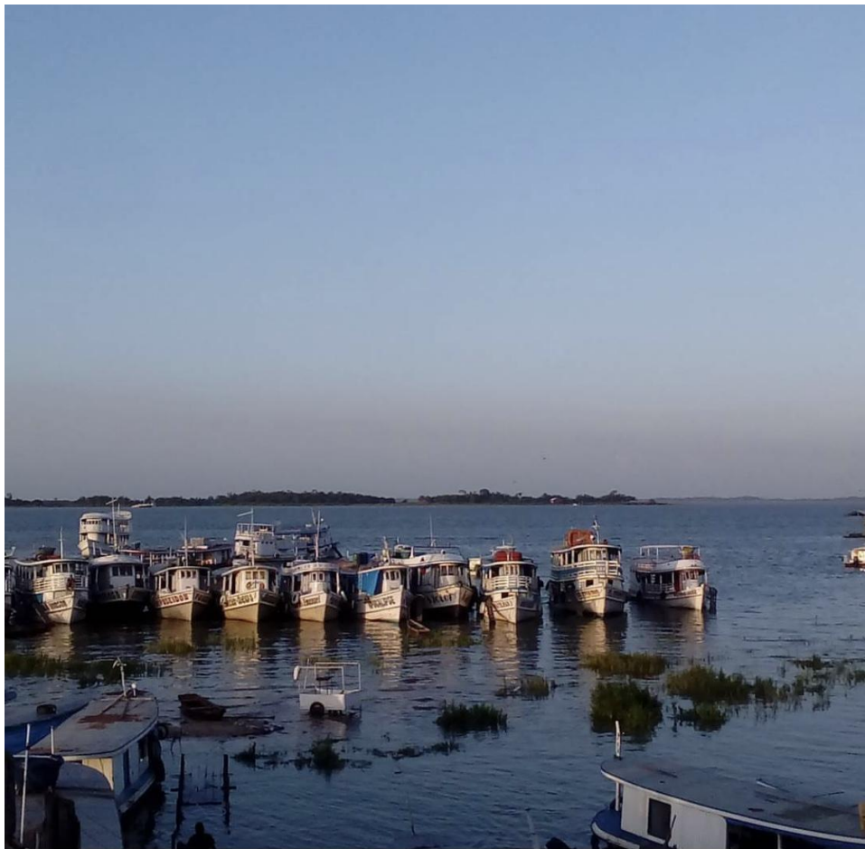
Barcos no Tapajós.