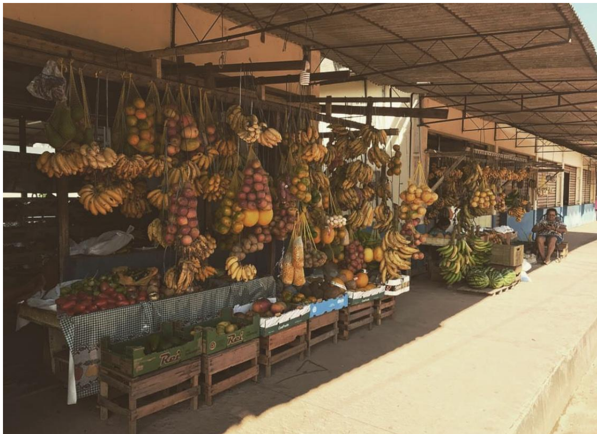
Banca de frutas nas imediações do Mercado 2000, no centro de Santarém.