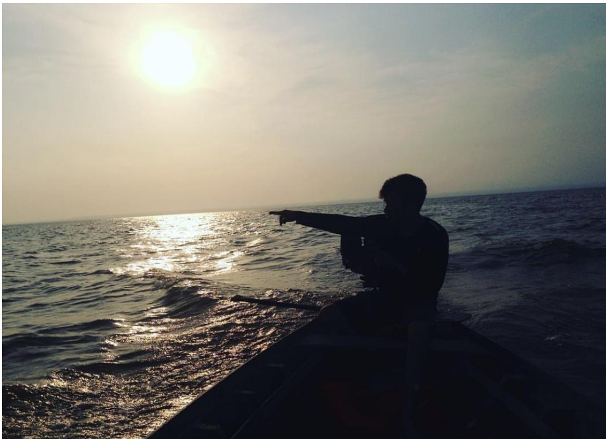
Atravessando o rio Tapajós, em um ponto de dimensões oceânicas