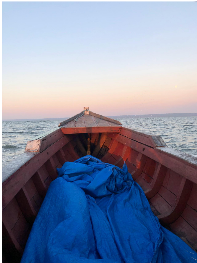
Cruzando o Tapajós com Josiel, do território Tupinambá para a Flona.