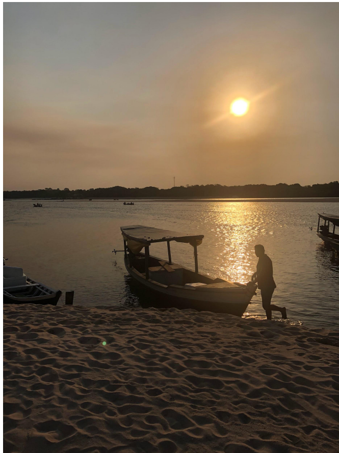
Pôr do sol no Igarapé do Amorim, próximo à aldeia São Francisco.