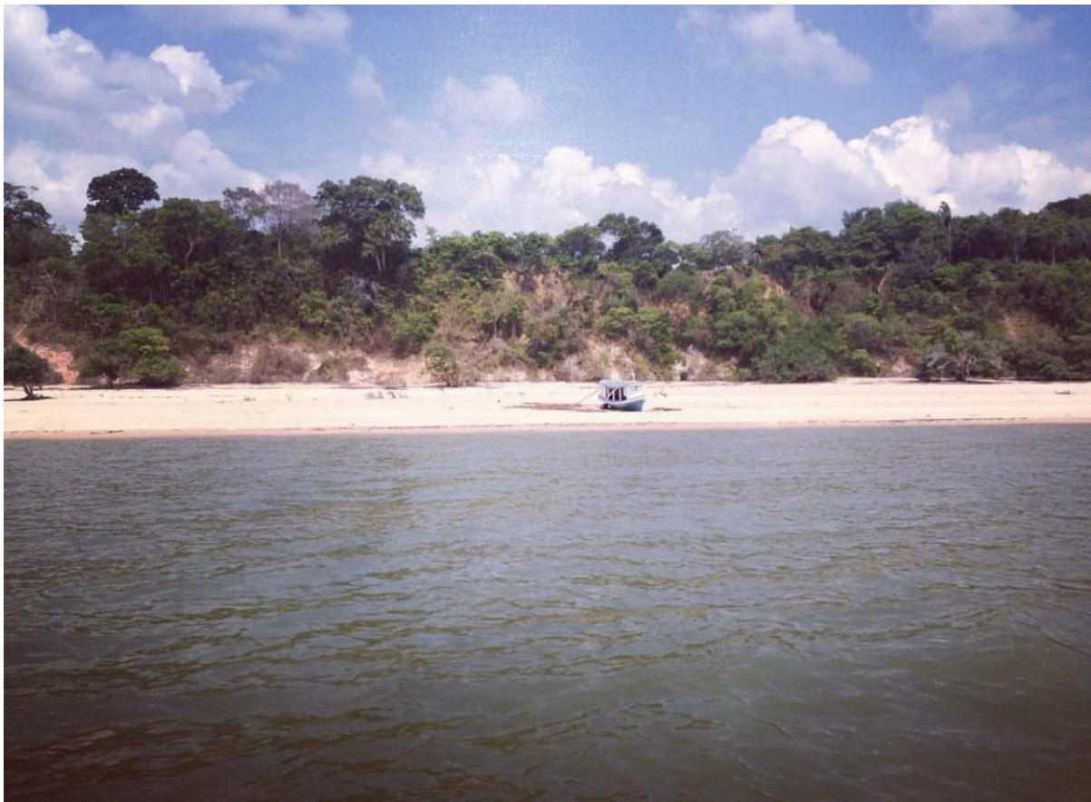
Praia no rio Tapajós.