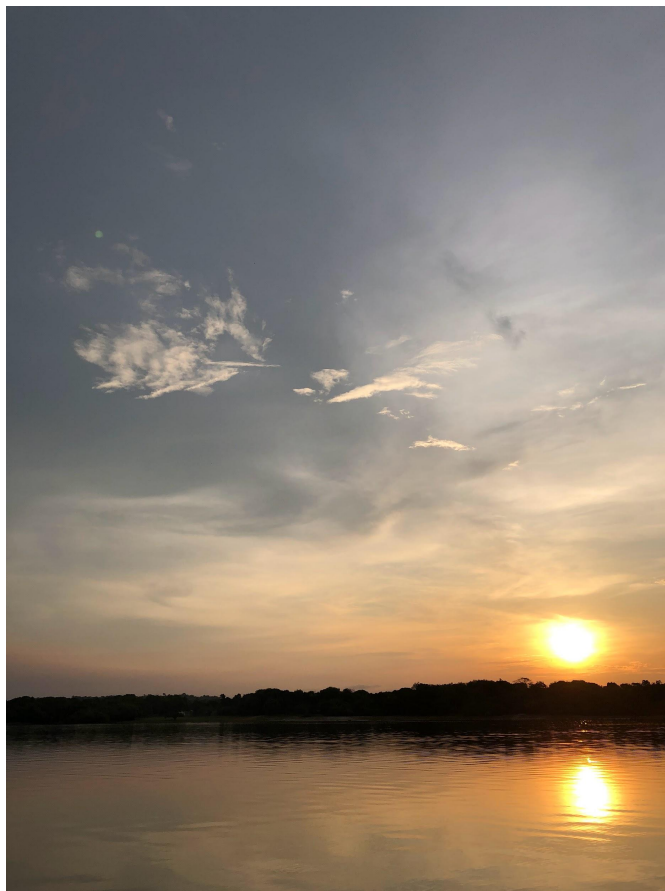
Pôr do sol no Igarapé do Amorim, próximo à aldeia São Francisco.