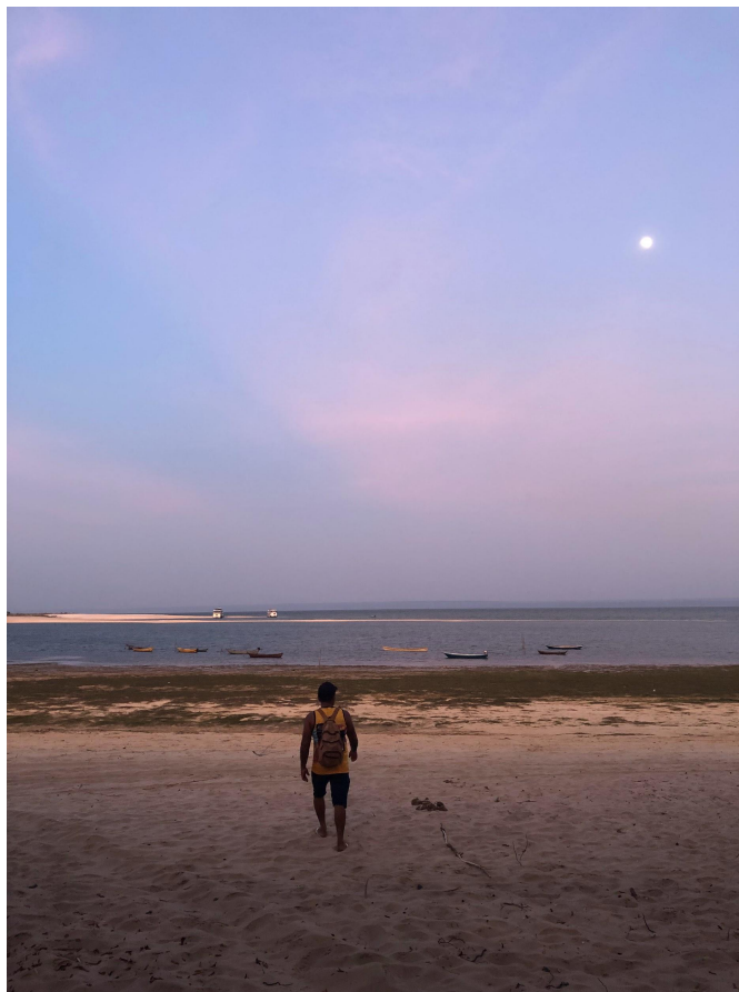
Anoitecer no Igarapé do Amorim, próximo à aldeia São Francisco.