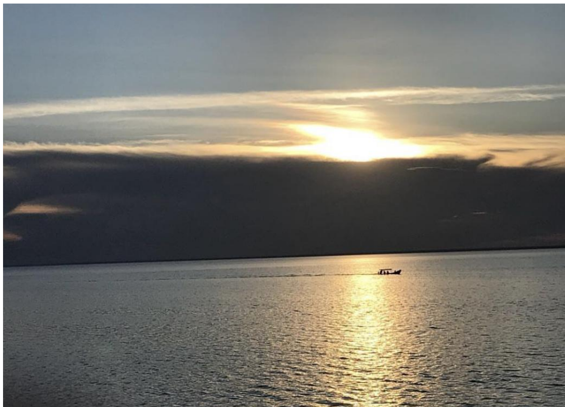
Embarcação cruzando o rio Tapajós no pôr do sol.