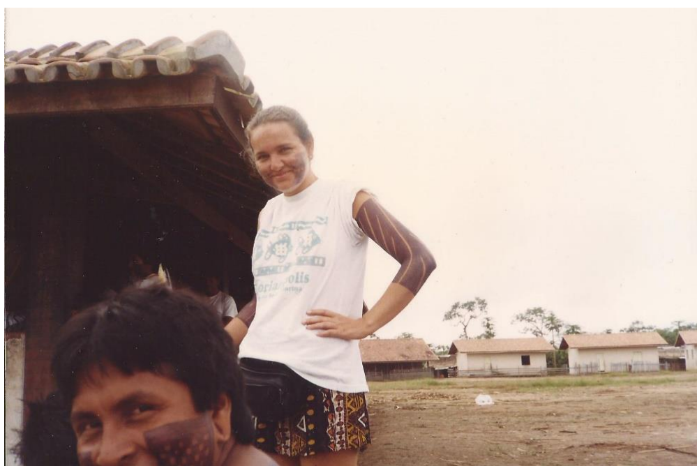
Na aldeia Cateté-Xikrin, T.I. Kayapó-Xikrin do Cateté, 1997

criticada, no âmbito dos estudos das evidências estéticas e simbólicas. São trabalhos que se utilizam de analogias comparativas (Stahl, 1993) e que se afastam das analogias indiretas simples que costumavam ser propostas neste campo de estudo, com comparações vis-à-vis entre a realidade etnográfica e a arqueológica. Na maioria desses trabalhos observa-se, principalmente, a apropriação e a aplicação de teorias e conceitos (p.ex. agência, perspectivismo ameríndio, predação) de uso comum na antropologia, para embasar o diálogo entre os dados etnográficos e os arqueológicos, e isso também é uma tendência da arqueologia dos sistemas simbólicos, em outros lugares do mundo.