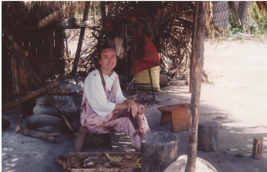
No acampamento de roça de Murawu Asurini, proximidades da aldeia Kwatinema. T.I. Koatinemo, 2005

Importante dizer que enquanto a etnoarqueologia processual se firmava, na década de 1980, como uma estratégia fundamental para a interpretação arqueológica, ao mesmo tempo, emergia uma nova perspectiva de arqueologia, ou seja, a arqueologia pós-processual e junto com ela um outro entendimento sobre como se deveria conduzir a pesquisa etnoarqueológica.