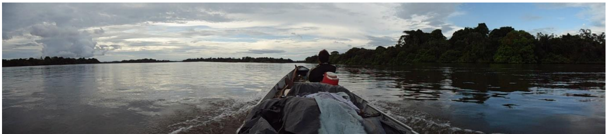
Rio Xingu, 2013

Dado Etnográfico, Prática Etnográfica e Conhecimento Arqueológico