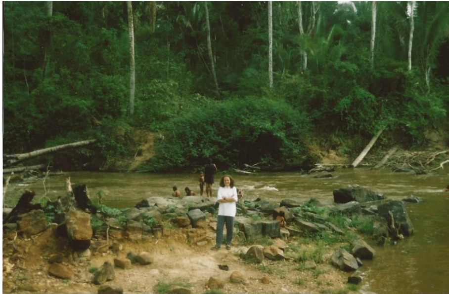
Na aldeia Djudjê-Kô, T.I. Kayapó-Xikrin do Cateté, 1996

analógica, corroborando as sínteses sobre os estágios evolutivos da humanidade. Este modo de apropriação dos dados etnográficos ficou conhecido na disciplina como analogia etnográfica.