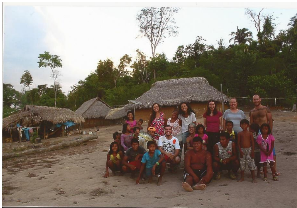
Arqueologia indígena e colaborativa, equipe de pesquisa, aldeia Itaaka. T.I. Koatinemo, PA, 2014