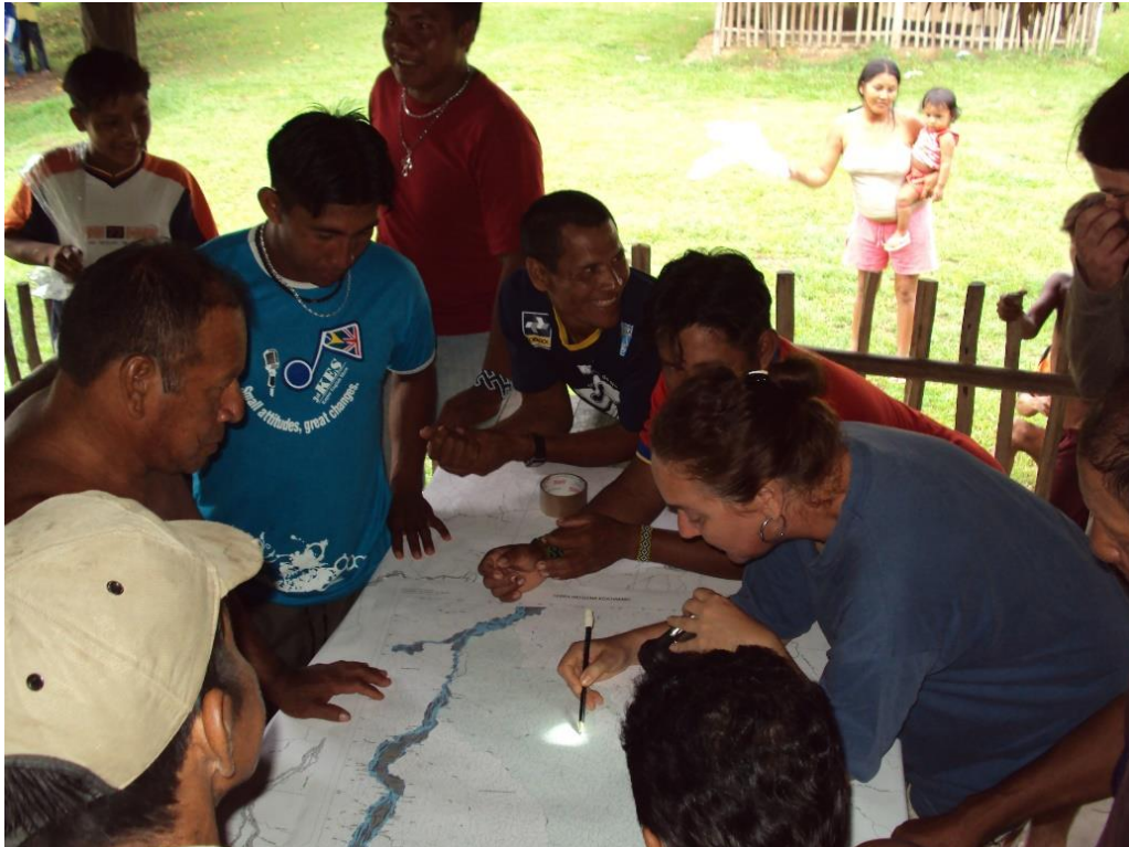
Arqueologia indígena e colaborativa. Planejamento da expedição pelo igarapé Ipiçava em busca das aldeias antigas Asurini, aldeia Kwatinema, T.I. Koatinemo, PA, 2010

Neste sentido, tenho como premissa de que para se fazer uma arqueologia socialmente comprometida e que se pretenda decolonial é fundamental estar sempre ciente dos contextos (sociais, econômicos, políticos, ideológicos, culturais, científicos) nos quais nós atuamos como pesquisadora(e)s e, também, de quem nós somos como pesquisadora(e)s.