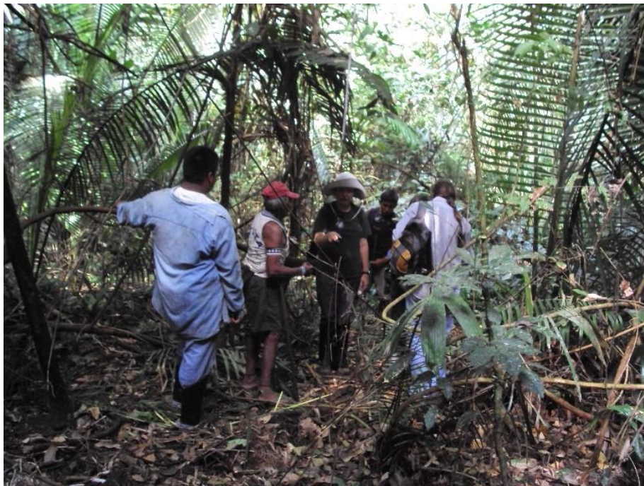
Arqueologia indígena e colaborativa com o povo Asurini do Xingu. Igarapé Piranhaquara T.I. Koatinemo, PA, 2013

na antropologia' foi o entendimento de que a(o) etnógrafa(o) está sempre imersa(o) em uma teia de relações intersubjetivas, sendo que não existe neutralidade na experiência do campo que, por sua vez, tem matizes contextuais específicos. Além disso, que a etnografia é um processo dialógico entre interlocutores que negociam ativamente uma visão compartilhada da realidade e constroem, a respeito dela, um saber etnográfico negociado. Se reconhece as individualidades envolvidas no 'encontro/confronto' etnográfico, a historicidade desta experiência e, finalmente, a reflexividade inerente à prática etnográfica. Este novo momento da antropologia também trouxe consigo o surgimento da(o) etnógrafa(o) 'nativa(o)', daquela(e) que estuda a sua própria cultura e que oferece outros modos de entendimento da mesma, visto que tem um outro tipo de envolvimento sensorial e emocional em relação aos comportamentos culturais e às pessoas com as quais interage na prática etnográfica (p.ex. CALDEIRA, 1988; CLIFFORD, 1986, [1983] 1998; MARCUS; FISCHER, 1986; REINHARDT; CESARINO, 2017; OHNUKI-TIERNEY, 1984).