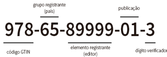
Figura 4 – Estrutura ISBN-13