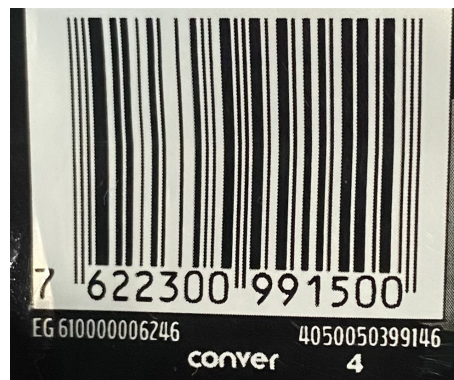
Figura 1 – Código de barras - Chocolate Lacta

Um dos códigos de barras mais usado no mundo é a Numeração Européia de Artigos, do inglês European Article Number (EAN-13), sucessor do antigo Código de Produto Universal, do inglês Universal Product Code (UPC), constituído de treze dígitos a_1 a_2 a_3 a_4 a_5 a_6 a_7 a_8 a_9 a_{10} a_{11} a_{12} a_{13} , conforme Figura 1 :