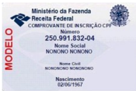
Figura 2 – Comprovante de inscrição no CPF

O CPF é um documento brasileiro feito pela Receita Federal que armazena informações cadastrais de contribuintes e tem a finalidade de identificar os cidadãos. Composto por uma numeração com onze dígitos, conforme a Figura 2 , o CPF é único e exclusivo para cada pessoa e só pode ser modificado mediante decisão judicial. Não há idade mínima para a inscrição e é permitida a brasileiros ou estrangeiros, residentes no Brasil ou exterior.