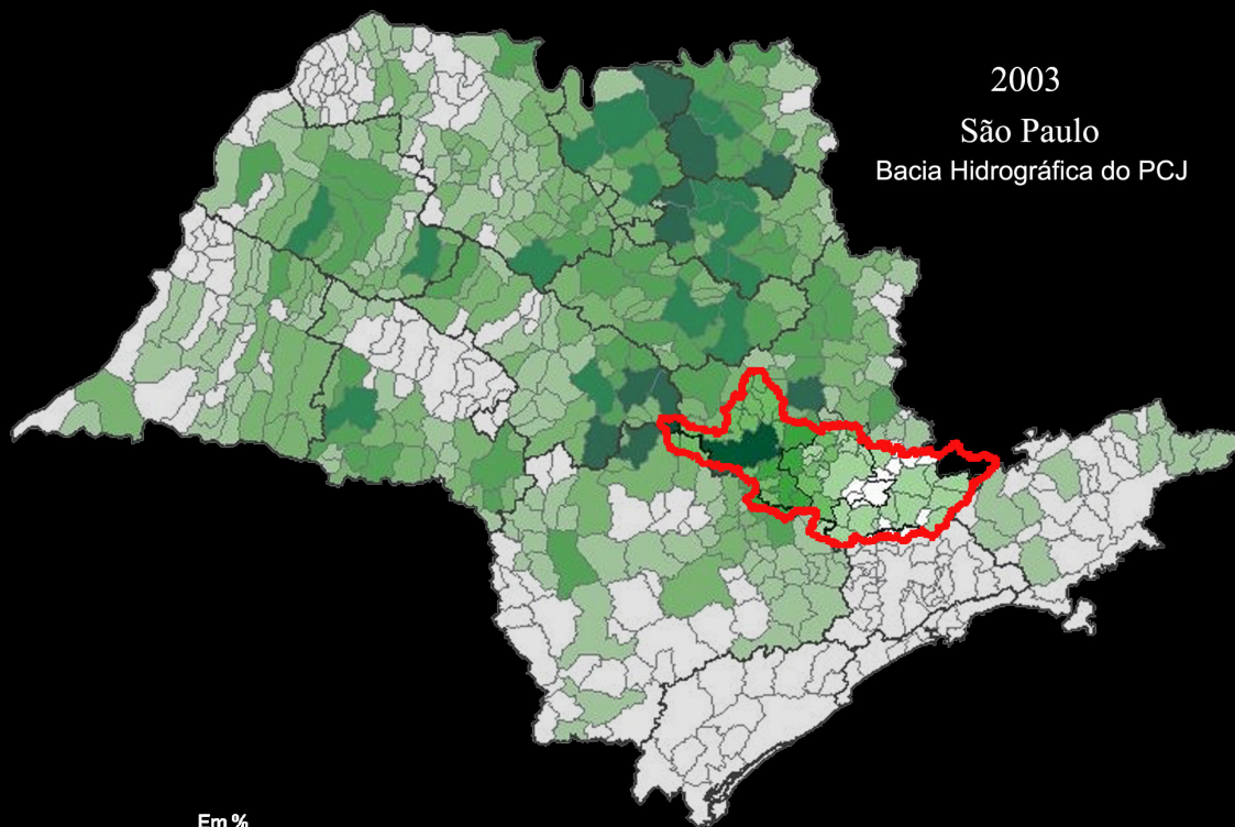
Ilustração 6: Localização e Densidade do Cultivo de Cana de Açúcar no Estado de São Paulo - destacando a Bacia PCJ - 2003

2003 São Paulo Bacia Hidrográfica do PCJ