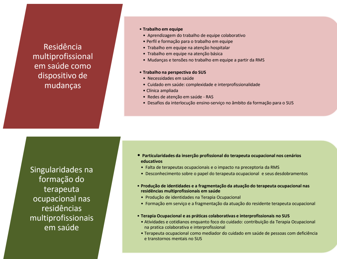
Figura 2: Resultados da pesquisa: categorias empíricas, subcategorias e temas identificados por meio da técnica de Análise Temática.

Como descrito anteriormente, as entrevistas realizadas nesta pesquisa procuraram captar percepções de tutores, preceptores e residentes acerca dos desafios e tendências do processo de educação profissional e interprofissional do terapeuta ocupacional no âmbito das residências multiprofissionais de saúde. Considerando a metodologia e os objetivos da pesquisa os resultados foram agrupados em duas categorias empíricas: (i) residência multiprofissional em saúde como dispositivo de mudanças e (ii) singularidades na formação do terapeuta ocupacional nas residências multiprofissionais em saúde, assim como ilustra a figura 2.