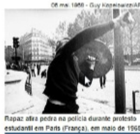
Rapaz atira pedra na polícia durante protesto estudantil em Paris (França), em maio de 1968