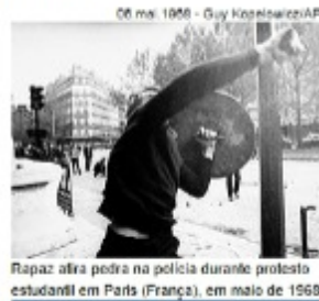
Rapaz atira pedra na polícia durante protesto estudantil em Paris (França), em maio de 1968

Em Maio de 68, a partir de manifestações estudantis ocorridas nas universidades francesas de Nanterre e Sorbonne, irromperam sucessivos movimentos de protestos em diversas universidades de países da Europa e das Américas, que ganharam uma dimensão ainda maior com a ampliação das revoltas para a classe trabalhadora.